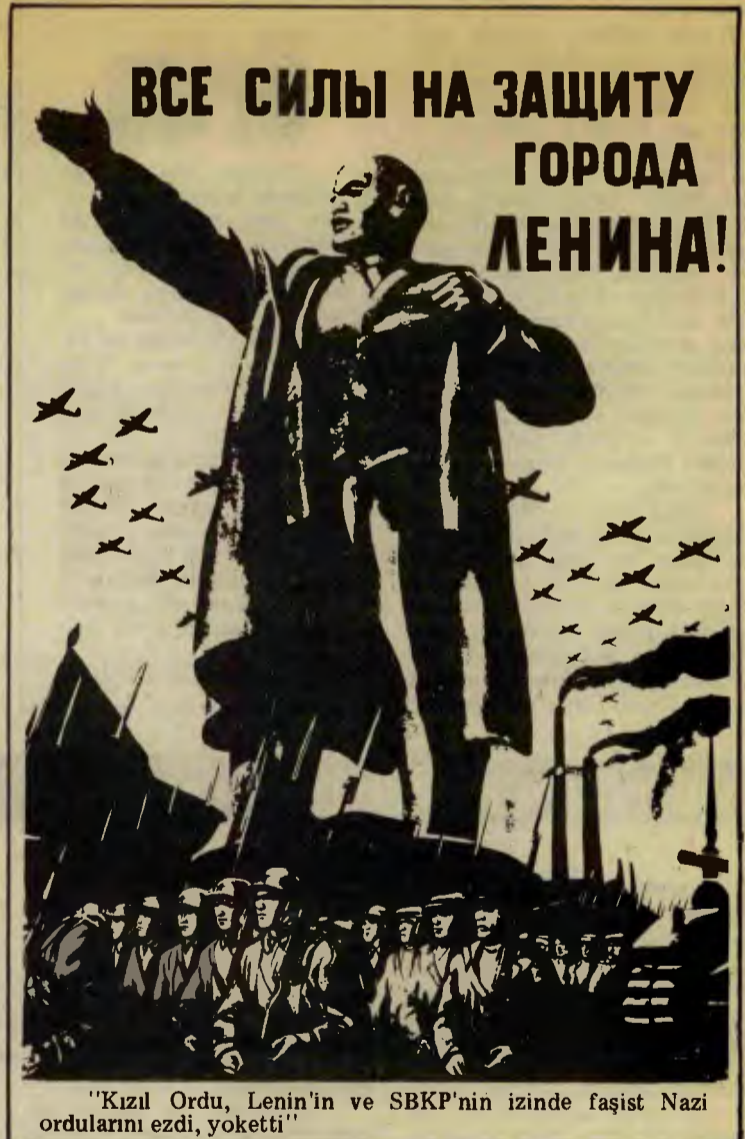
"Kızıl Ordu, Lenin'in ve SBKP'nin izinde faşist Nazi ordularını ezdi, yoketti"

Türkiye Komünist Partisi, Büyük Oktobr'ın verdiği derslere bağlı kalarak ve onları canlı bir şekilde Türkiye koşullarına uygulamak için bütün ilerici yurtsever güçlerin anti-emperyalist, anti-faşist eylem birliği politikasına ardıcıl bir şekilde devam edecektir.