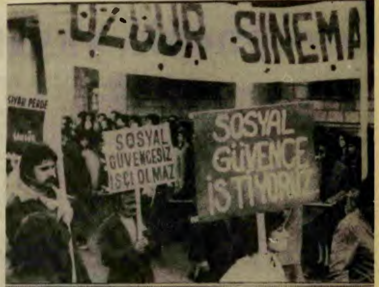
Sinema emekçileri yürüyüş sırasında.

riyüşü, MC'nin, onun temsil ettiği bir avuç işbirlikçi holdinglecinin, ne denli geniş halk kesimlerinde tepki yarattığını kanıtıyor.