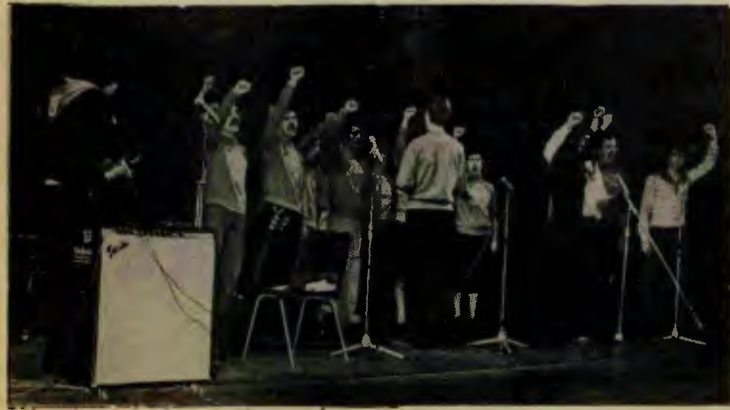
İTİB Korusu kutlama toplantısında

Toplantı, Yunanistan Komünist Partisi, Irak Komünist Partisi, Portekiz Komünist Partisi ve AKEL temsilcilerinin yaptığı Büyük Ekim Devrimi'nin uluslararası önemini anlatan konuşmalarla başladı. Daha sonra yapılan forumda dinleyicilerin katkıları alındı ve soruların yanıtları. Böylesi bir kutlamanın bir yandan burjuvazinin anti-Sovyetizm ve anti-komünizm kampanyasına öte yanda ise dünyada yeniden baş kaldıran revizyonizme iyi