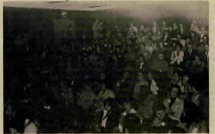
Ekim Devriminin 60. Yılı kutlamasından bir an

bir yanıt olduğu vurgulandı. Bu arada Türkiye Komünist Partisi'nden gelen, Büyük Ekim Devrimi ile TKP'nin kuruluşu ve Türkiye komünist hareketi arasındaki organik bağları vurgulayan mesaj salonda büyük coşku yarattı, dakikalarca uzun uzun alkışlandı. Forum, TKP'nin mesajındaki "Yaşasın proletarya